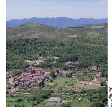
Vue sur Joncels

6. 350 m, 31 T 515894 4842505 Laisser la route dans le lacet et monter la calade en face pour se rendre au village fortifié de Joncels. Aller à droite, passer la voie ferrée puis partir à gauche pour retrouver le parking.