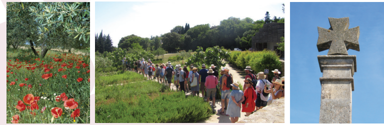
Sur le territoire des communes de : SAINT-CHRISTOL