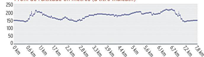
Profil de l'altitude en mètres (à titre indicatif)

Peu avant les ruines, à l'embranchement, possibilité d'aller tout droit et découvrir Saint-Bauléry (attention à proximité circuit les Mathurins) ou tourner à gauche et suivre le chemin qui monte entre pins, pignon et pins d'Alep. Regagner (aire de pique-nique) dans la pinède (point 2) le sentier qui redescend vers le cimetière et le parking.