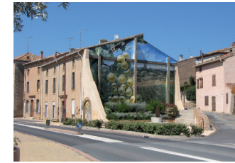
Entrée du village

1. Du parking, prendre à droite la rue principale (avenue de Béziers), puis bifurquer à gauche sur la D36 direction Cazedarnes. Peu après le cimetière, à la sortie du village, tourner à droite, traverser les vignes, passer le gué et emprunter le sentier qui monte vers puis dans la pinède. A la fourche, continuer à gauche et rejoindre la piste forestière.