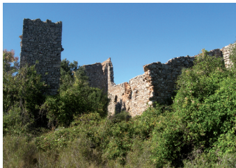
Les ruines de Saint-Bauléry

Les ruines de cet édifice se trouvent à 2 km à l'est du village en direction de Cazedames.