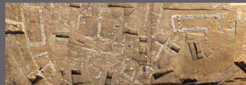
Mas de Roux village

À l'auditorium du musée Henri Prades (entrée libre)