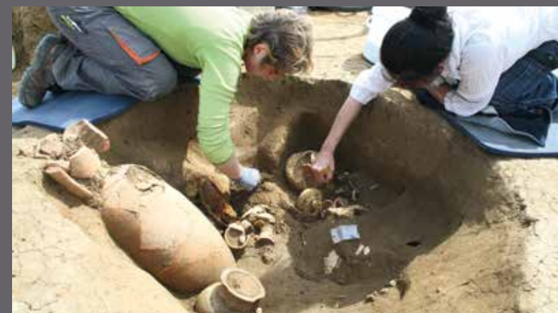
St Pastour Nord, Vergèze