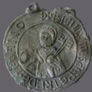
Enseigne de pèlerinage, Mas de Roux, Castries

Sur réservation au 04 67 99 77 24 ou 04 67 99 77 26 Tarif : 5,00 € par personne