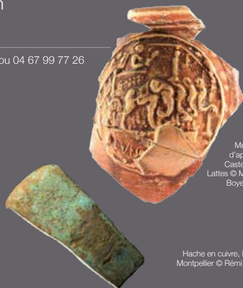
Médaille d'applique, Castelle GR, Lattes