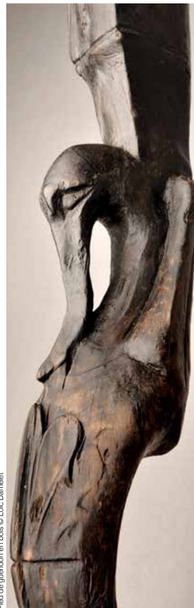
Pied de guéridon en bois