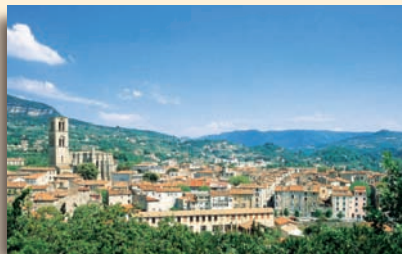
Vue générale de Lodève

de la culture vivrière sur ce territoire. Le retour se fait par le sentier GR® 71, ancienne voie gallo-romaine reliant Le Pertus à Lodève, ancienne cité épiscopale influente, implantée au confluent de la Lergue et de la Souldres.