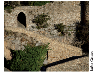
Minerve, porte basse

1. Du parking, descendre vers Minerve par la route goudronnée. Continuer par la rue de la Tour. A la Place du monument, descendre en face par la rue des Martyrs. En bas de celle-ci, prendre à gauche puis à droite, rue du Caire. Plus bas, tourner à gauche pour gagner les remparts. Passer ensuite par les escaliers métalliques et, en bas, aller à droite pour se rendre sur la passerelle et traverser la rivière.