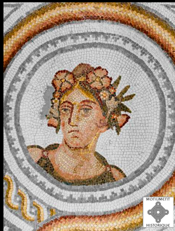
Villa & mosaïques