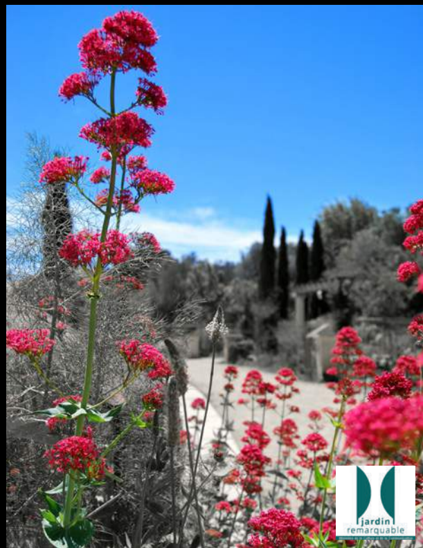
Art & nature