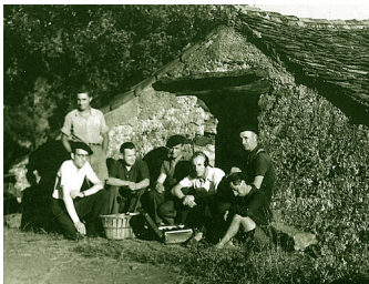
Maquisards - radio

À partir de la fin 1943, des mouvements de Résistance se sont développés dans les Hauts Cantons et, en août 1944, plusieurs accrochages sérieux ont eu lieu avec les troupes allemandes qui se repliaient vers la Méditerranée. Le sentier de la résistance, à Prémian, rend hommage à ces hommes de courage.