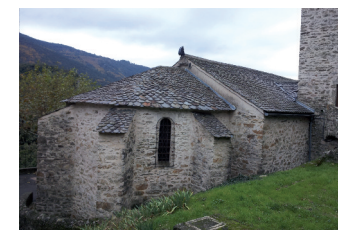
Eglise de la Caminade