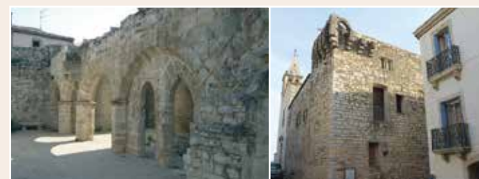
Le mur à arcades 2 et le bastion à machicolis 3 sont des vestiges du château des évêques, agrandi à la fin du XIII e siècle.