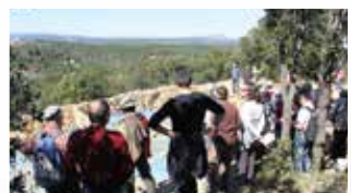
Depuis la ville haute, panorama sur les Cévennes, le Ventoux, le littoral...

Les enceintes antiques peuvent être longées sur plus d'1 km au nord. A mi-parcours 4 , on peut comparer le mur de la ville haute, avec le mur de la ville basse construit avec des blocs plus imposants.