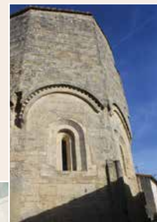
L'abside de l'église Saint Jean 1 : art roman de la fin du XII e siècle.

XII-XVIII e siècle Autour du château des évêques de Maguelone