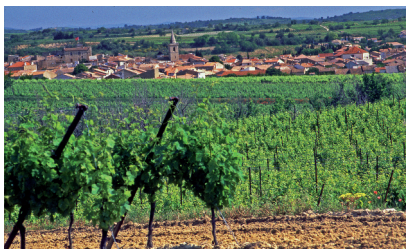
Village de Puisserguier

Un magnifique circuit qui vous fera découvrir toutes les richesses et les trésors de la garrigue languedocienne.