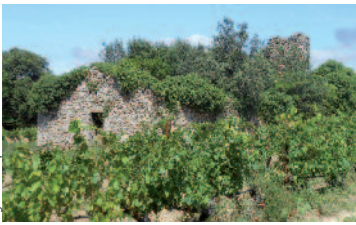
Sylvie Herpson Grange monastique

La grange monastique de Sauvanès est une dépendance de l'Abbaye de Sylvanès (Aveyron). Fondée en 1139 sur une terre offerte par le seigneur Ermengaud de Fouzillon, riche en terre et en vignes, elle devint le modèle d'une ferme bien tenue.