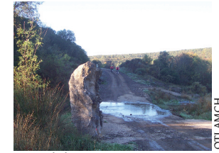
Pierre de l'Ours

1. Face au panneau de départ, descendre à droite la route goudronnée sur 600 m, jusqu'à un croisement. Prendre à droite, suivre cette route et atteindre un embranchement. Continuer tout droit vers le pont. Arriver à un carrefour.