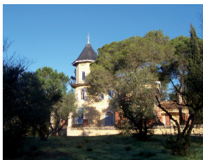
Moulin de Ciffre

Sur les sentiers découpés à travers la garrigue et les vignes, les promeneurs découvrent des paysages s'ouvrant sur les pechs, les coteaux et la plaine, des espaces boisés de chênes et de pins, des domaines viticoles et des sites remarquables : le plan d'eau du barrage du Tauroussel (avec une aire de pique-nique), la pierre de l'Ours (taillée naturellement comme cet animal), le château du Moulin de