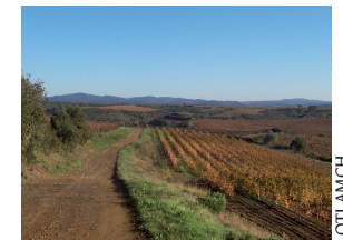
Chemin de l'Agnus

2. 105 m, 31 T 512833 4814807 Descendre à droite vers le Moulin de Ciffre, le contourner et, après la grange à gauche, poursuivre sur le chemin de terre dans le vignoble. Passer à gué le ruisseau et au croisement, emprunter à droite la route goudronnée. Franchir le ruisseau et poursuivre sur 400 m.