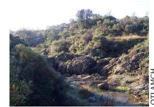
Aire de pique-nique

3. 141 m, 31 T 512793 4816592 Poursuivre par la piste bétonnée à gauche sur moins de 150 m. La quitter pour partir à gauche sur le chemin en terre. A l'embranchement, tourner à droite sur le chemin de l'Agnus ( chemin de l'Agneau ) appelé ainsi pour son mas en haut de la colline qui abritait une bergerie.