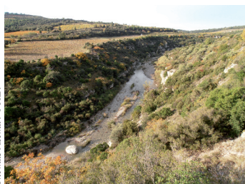
Paysage autour de La Caunette

En parcourant ce sentier vous constaterez que le village de La Caunette présente différents paysages. D'abord, les gorges de Coupiat, profondément taillées dans le calcaire, tranchent le territoire du nord au sud. Sur les plateaux en pente douce sont couverts de garrigue à chênes kermès, cistes, thyms, chênes verts... et quand le sol se fait plus profond, de