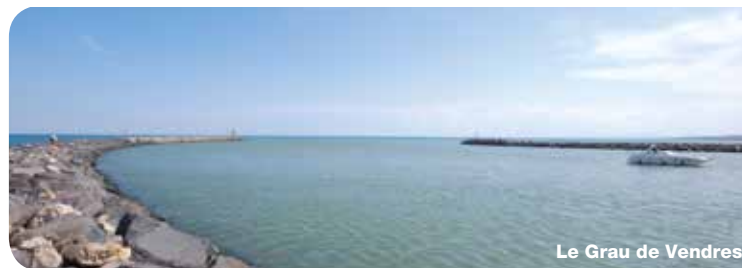
Le Grau de Vendres

Sur le territoire de la commune de : VENDRES