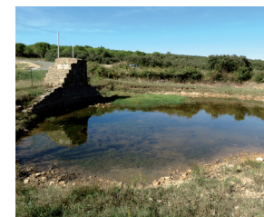
Mare Natura 2000

Traverser le plateau aride aux roches calcaires, profiter du panorama sur la vallée de Donnadiet et de Babeau-Bouldoux.