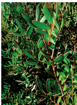
Le Pistachier Lentisque

C'est un arbuste de 1 à 3 m de haut, typiquement méditerranéen. Son feuillage est persistant, à forte odeur résineuse, avec une écorce brune et écailleuse. Il fleurit au printemps et en automne. Après fécondation, ses petites drupes en grappes d'abord vertes puis rouges deviennent noires à maturité. Les fleuristes utilisent ses feuilles en garnitures de bouquets. On extrait de son écorce une résine utilisée comme expectorant et stimulant.