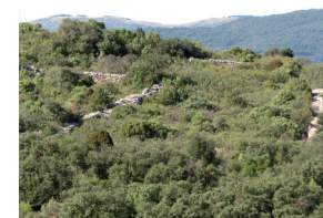
Petits murets carrés

2. 287m, 31 T 492302 4805883 Au troisième croisement, prendre à droite sur quelques mètres puis à gauche en direction de Tudery. A l'embranchement, tourner à gauche, descendre le chemin et, se diriger de nouveau à gauche.