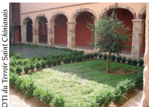
Le cloître de l'abbaye

Construite au X e siècle par les moines bénédictins, l'abbaye fut ravagée pendant les Guerres de Religion au XVI e siècle. Les bâtiments actuels, construits entre le XVII e et le XVIII e siècles font l'objet de remaniements permanents. Aujourd'hui l'abbaye abrite la mairie, la façade a acquis sa forme définitive au XIX e siècle.