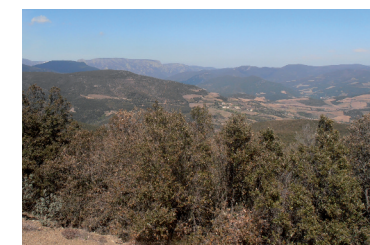
Vue depuis le sentier