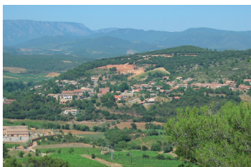
Vue sur le village de Pierrerie

Pierrerie a été bâti autour d'une source : la Font Petrarua, aujourd'hui la fontaine et les lavoirs sont le témoignage de cette vie autour de l'eau. Sur un mur de la fontaine un écriteau (en partie effacé) indique : "Font Petrarua : En 860, près de ces bassins existait depuis longtemps Villa Petrarua, mentionnée encore sous ce nom dans les lettres de Saint-Louis en 1247. Avant de devenir en 1373 Peyrasrua sous le régime de Jean le Bon. En 1643, il s'écrit Peyrerue. Depuis 1770 nous sommes à Pierrerie et l'eau coule toujours".