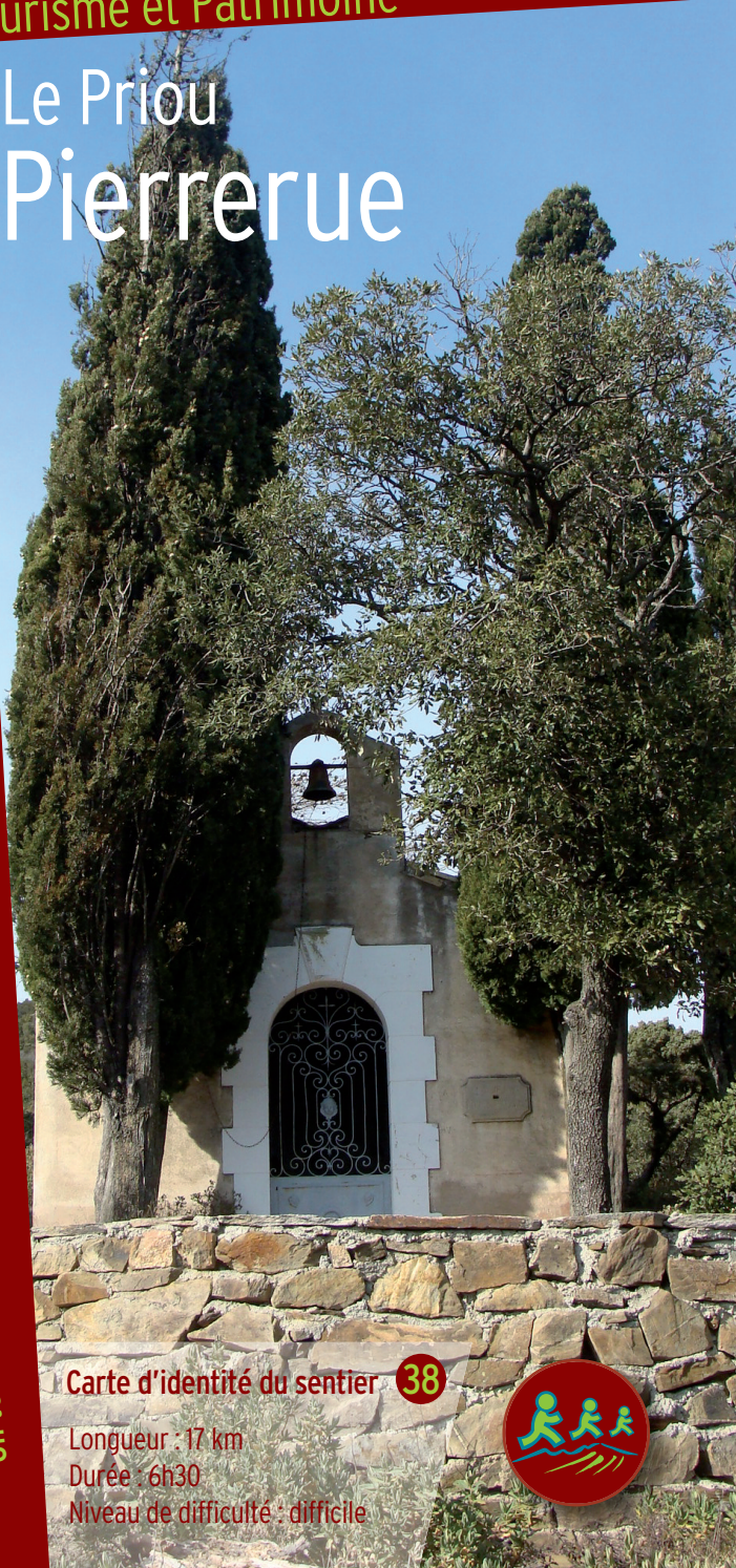
agence AOC - Béziers - photo couverture : Chapelle Sainte-Suzanne - OTI du Terroir Saint-Chinianais