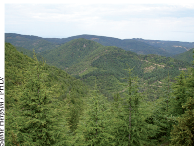
La Plaine de Sadde

Au XIX e siècle, la forêt, exploitée massivement par les verriers et les charbonniers, avait pratiquement disparu des plateaux du Haut-Languedoc, l'érosion des sols provoquant des inondations dévastatrices.