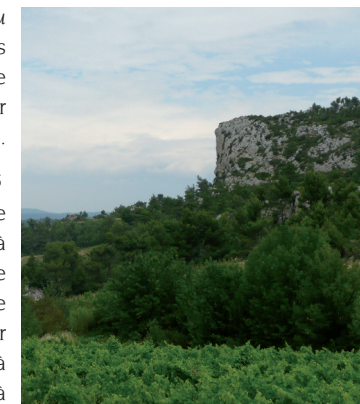
Paysages autour d'Agel