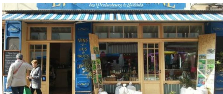
2018 | epicerie fleury

17 boulevard de la Liberté 34700 LODEVE Tél. +33 4 67 88 50 89