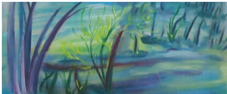
2019 Irène Faivre