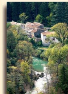
Le Grenouillet

Le hameau du Grenouillet est l'un des six hameaux composant la commune de Gornières. Situé au cœur de la forêt domaniale de la Séranne, son arboretum a été créé et planté par Charles Flahault (1905), qui étudiait le comportement des résineux et des feuillus méditerranéens, dans le cadre du reboisement du mont Aigoual. On y trouve aujourd'hui des sapins de Numidie, des séquoias, des frênes fleurs, de l'oranger des osages... En bordure de la Vis, sous les conifères, c'est le lieu idéal pour une halte fraîcheur.