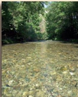
Rivière de la Vis

Belle rivière aux eaux transparentes, la Vis crée ici un havre de fraîcheur et de verdure qui contraste avec les paysages arides du causse environnant. La végétation devient luxuriante, avec des espèces caractéristiques des berges de rivières (riplisylve) : peupliers et frênes, saules et aulnes. La pureté et la fraîcheur des eaux font aussi le bonheur des truites sauvages autochtones, très recherchées par les pêcheurs. Tout ce petit monde de la rivière doit périodiquement résister au régime des crues de la Vis, dont le débit peut décupler en une journée ! Il est difficile d'imaginer en contemplant la Vis qu'elle jaillit littéralement de terre, une quinzaine de kilomètres en amont, à la Foux de la Vis, après avoir parcouru 13 kilomètres sous la roche !