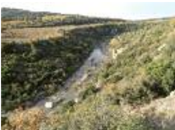
Paysage autour de La Caunette

En parcourant ce sentier vous constaterez que le village de La Caunette présente différents paysages. D'abord, les gorges de Coupiat, profondément taillées dans le calcaire, tranchent le territoire du nord au sud. Sur les plateaux en pente douce sont couverts de garrigue à chènes kermès, cistes, thyms, chènes verts... et quand le sol se fait plus profond, de