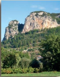
Falaises du Thaurac

Le massif du Thaurac, situé dans la haute vallée de l'Hérault, a une forme triangulaire d'environ 5 km 2 et se dresse, au-dessus du fleuve, à près de 500 m d'altitude. Couvert d'une végétation traditionnelle de garrigue, où domine le chêne vert, cet îlot calcaire, entouré de falaises, est un paradis pour les grimpeurs (escalade) avec pas moins de 610 itinéraires de 10 à 120 m. La multitude d'avens et de grottes dissimulés sur tout le massif en a fait un lieu de refuge depuis la nuit des temps, de l'homme de Neandertal aux Maquisards en passant par les Camisards. La grotte la plus célèbre est celle des Demoiselles dites des Fées. Explorée pour la première fois en 1780, et exploitée depuis 1931 à l'aide d'un funiculaire, elle se visite toute l'année.