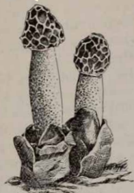
Satyre puant ou œuf du diable.