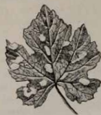
Mildiou du raisin sur une feuille de vigne.