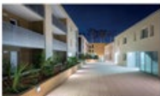
BENTO SERRA Route de Montpellier Livraison Décembre 2017