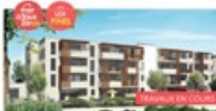
BAILLARGUES DOMAINE DES LAURIERS

En prolongation du nouvel éco-quartier Joseph-Suay, sur la Route Impériale, au coeur d'un environnement qualitatif.