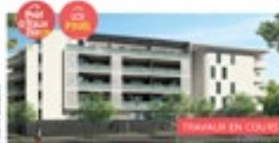
JUVIGNAC RÉSIDENCE OXALIS

Création d'un nouveau quartier intergénérationnel au coeur d'un environnement verdoyant à deux pas du Parc St Hubert et du Golf de Fontcaude.