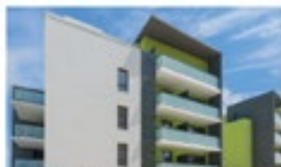
LE PATIO Eco quartier Roque Fraisse Livraison Mars 2016