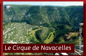
Le Cirque de Navacelles