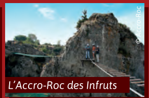
L'Accro-Roc des Infruts