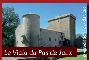
Le Viata du Pas de Jaux