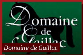
Domaine de Gaillac