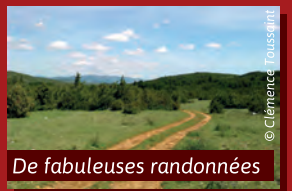
De fabuleuses randonnées