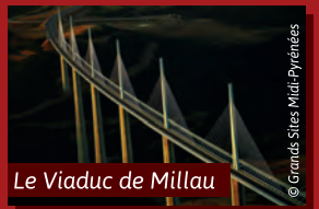
Le Viaduc de Millau