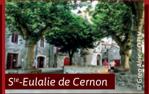
St-Eulalie de Cernon