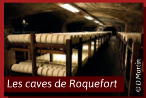
Les caves de Roquefort