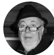
« Osons les Fables de la Fontaine » avec les Cours Cochet - Delavène

• 2 Stages week-ends sur le plateau du Théâtre.