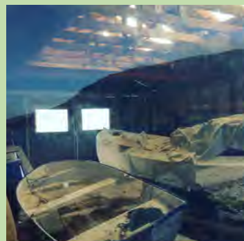
ÁST 3