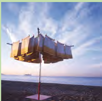
Sans Titre © Noël Dolla