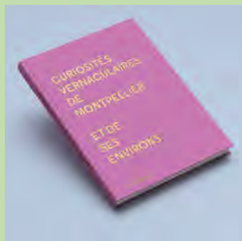
Curiosités vernaculaires de Montpellier et de ses environs