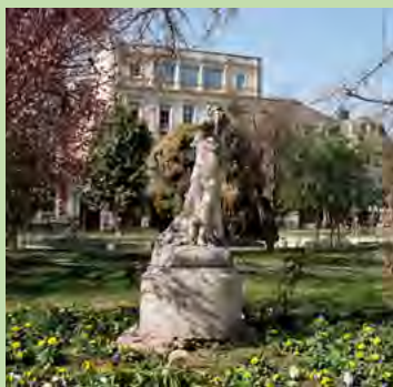
Les restes de l'enfant à la flûte de pan © Gabriel Desplanque