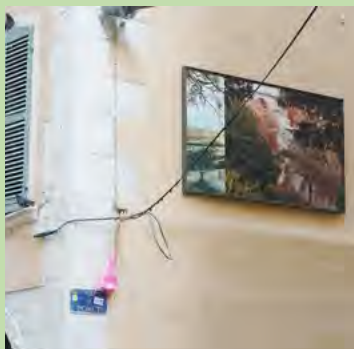
Vues de Montpellier