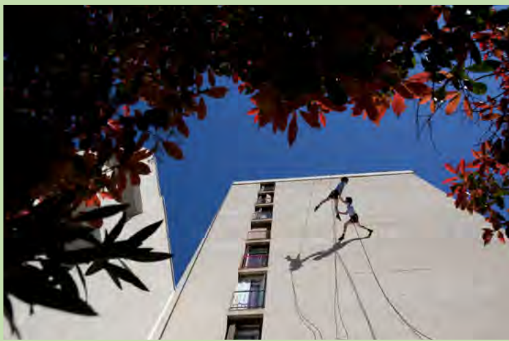
REPITE CONMIGO, CIE DELREVES - ZAT MOSSON

De quartier en quartier la ZAT envisage l'espace public comme lieu de liberté et d'expériences, où résonne projets artistiques et projets urbains. Cette Zone devient source de créations et lieu d'exposition. La Ville de Montpellier conte une nouvelle histoire et invite les citoyens à se l'approprier.