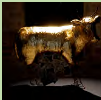
Sans Titre © TAFTA, 2017, ADAGP