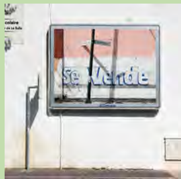
Sans Titre © agnesfornells