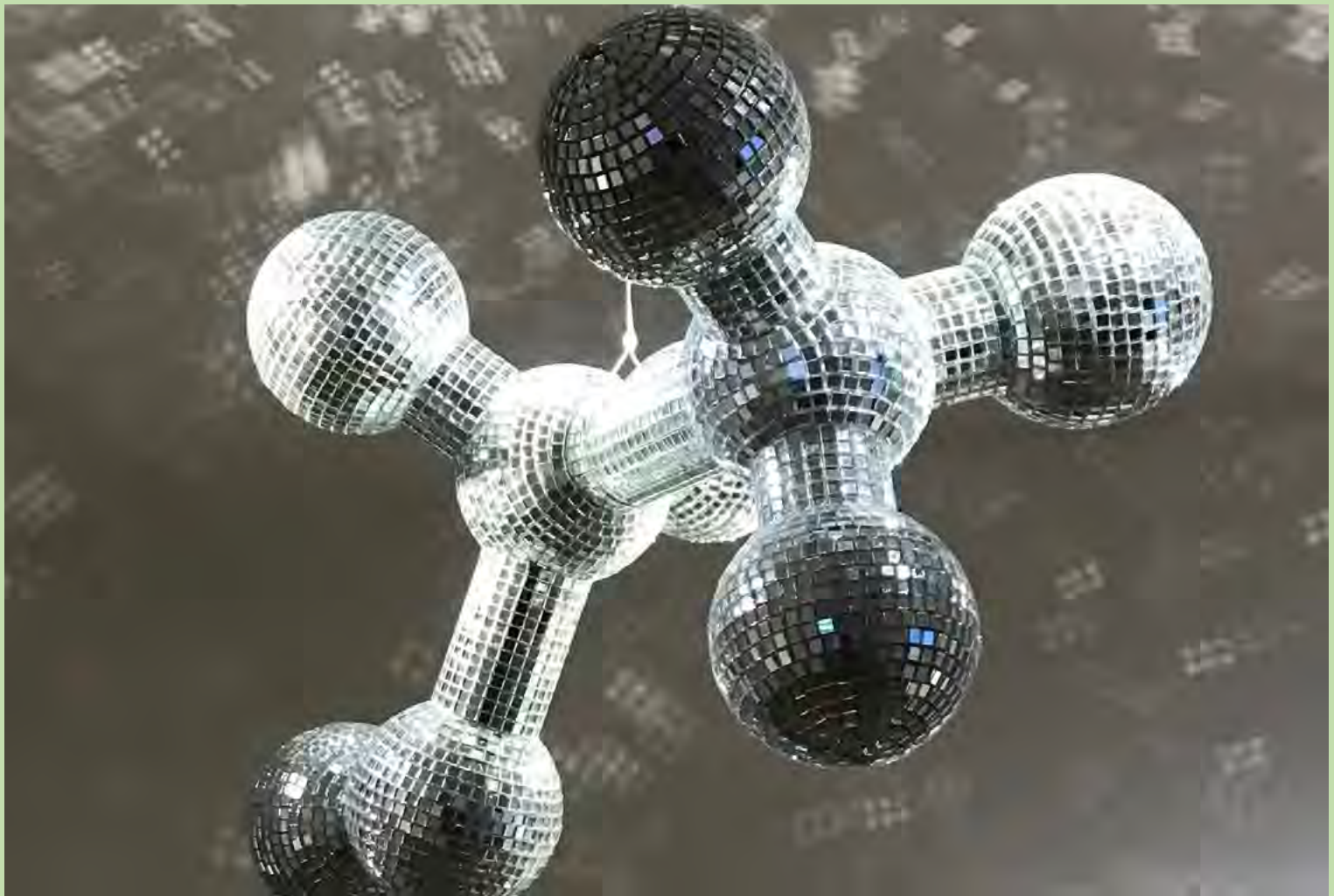
(BAS) JEANNE SUSPLUGAS DISCO BALL © JEANNE SUSPLUGAS