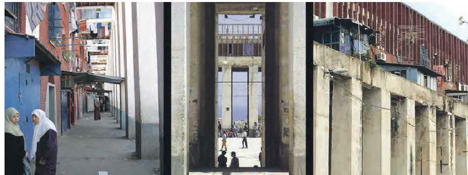
200 colonnes, Fernand Pouillon

Toulouse Centre des Cultures de l'Habiter – 5 Rue St-Pantaléon, jusqu'au 26 mai 12h30/19h (du mercredi au vendredi) 14h30/19h (samedi)