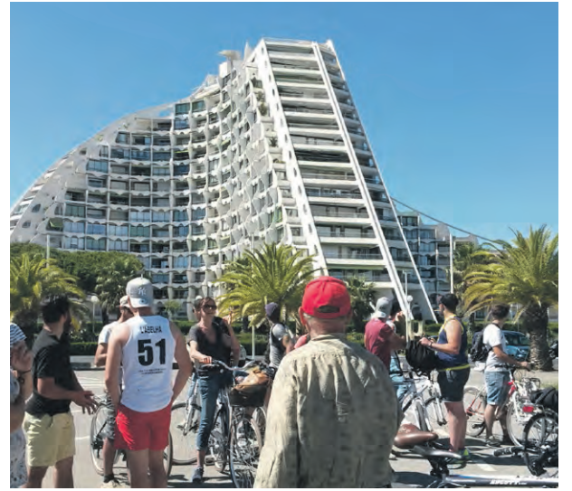
Balade urbaine à vélo – La Grande-Motte

Centre Épidaure 124-126, rue des Apothicaires, du 15 mai au 15 juin 09h/12h et 14h/16h30 SANTÉ ET SALUBRITÉ Répondant au centre Épidaure de l'Institut régional du Cancer de Montpellier, des étudiants de l'ENSAM ont imaginé un dispositif pour sensibiliser le public aux notions de confort et de gestion dans le rapport à l'ensoleillement et à l'exposition au soleil. ENSA Montpellier : 04 67 91 89 89