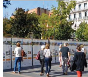
Exposition 40 ans d'archi à Toulouse

Maison de l'architecture Occitanie-Pyrénées : 05 61 53 19 89