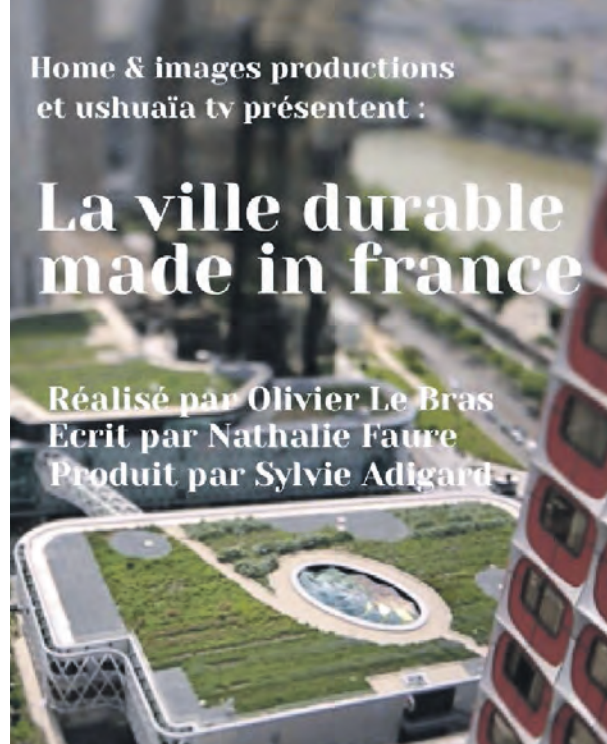
Affiche du film documentaire « La ville durable made in France »

Toulouse Cinéma l'American Cosmograph, 04 juin – à partir de 20h30 LA VILLE DURABLE MADE IN FRANCE Projection d'un film qui aborde le sujet de la ville durable et écologique suivie d'un débat animé par le CAUE 31, une sociologue et des architectes urbanistes. Tarif d'une place de cinéma, CAUE 31