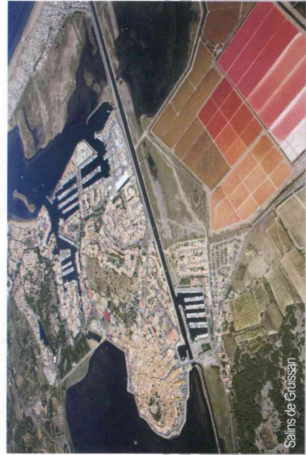
Sains de Gruissan