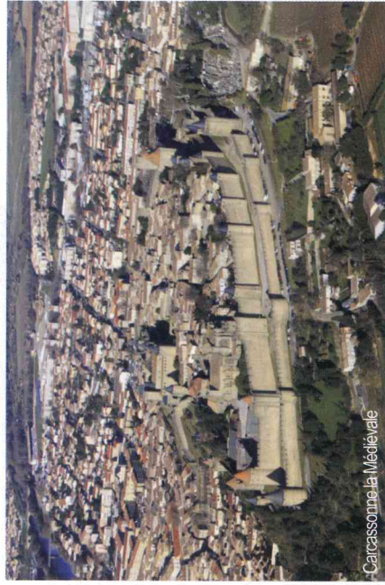
Carcassonne la Médiévale

Partez sur les traces du Canal du Midi, en direction de Carcassonne et de sa cité mythique dont la forteresse est classée au patrimoine mondial de l'UNESCO.