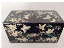
Boîtes à bijoux