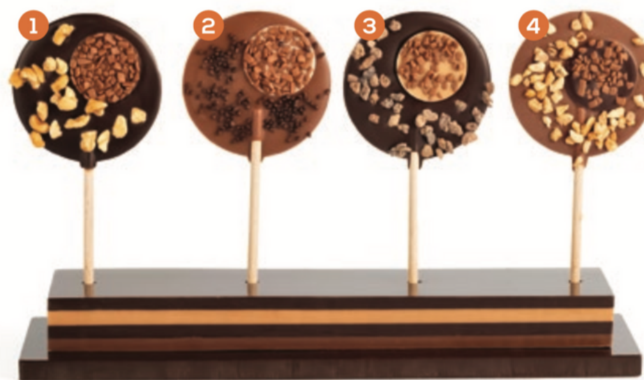
1 Noir noisettes 2 Lait décor chocolat