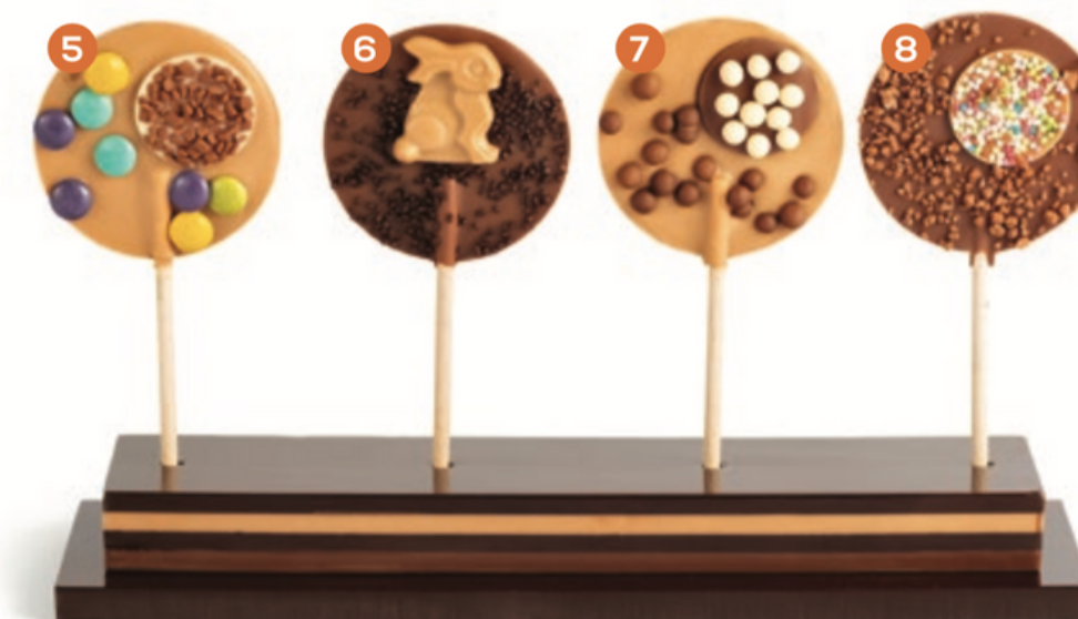
5 Blanc caramélisé décors dragéifiés au chocolat 6 Lait lapin blanc caramélisé 7 Blanc caramélisé billes de céréales 8 Lait sucre pétillant