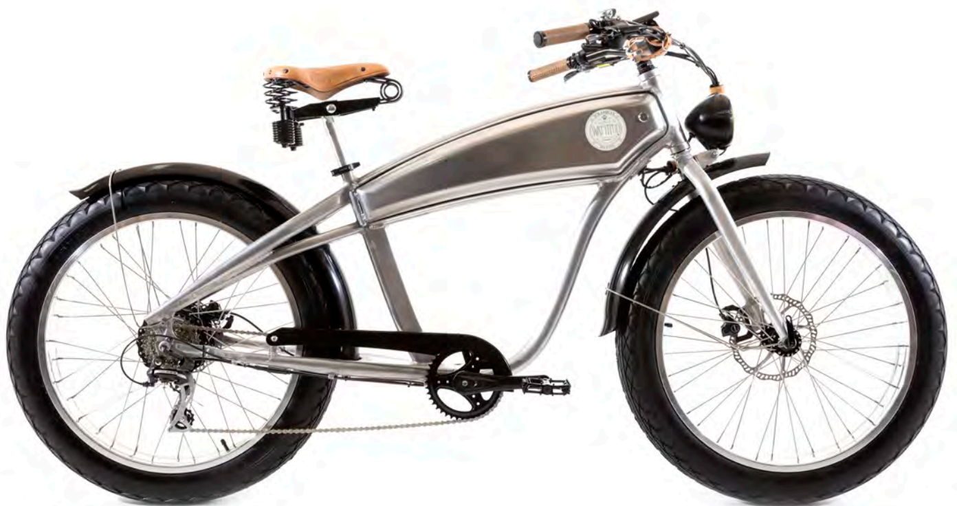
E-SCRAMBLER 200 Vélo électrique