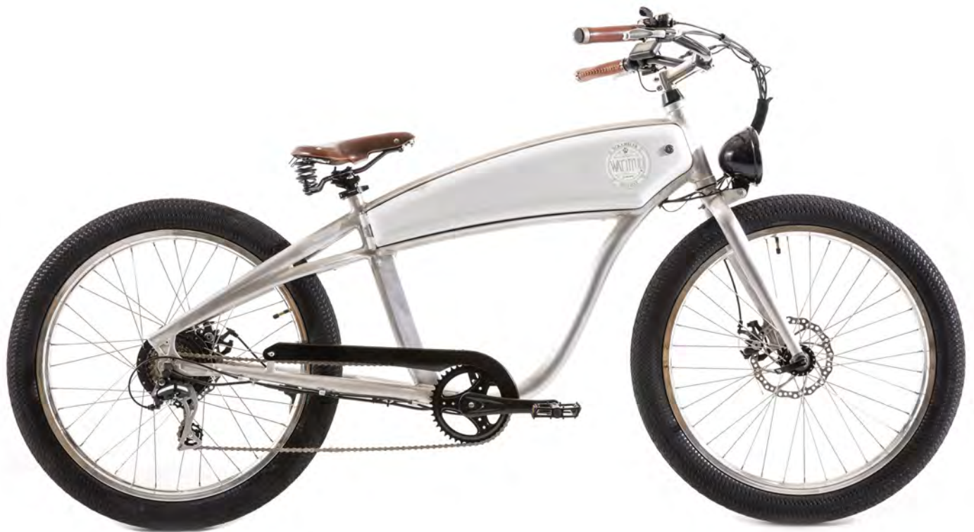
E-SCRAMBLER 40 Vélo électrique