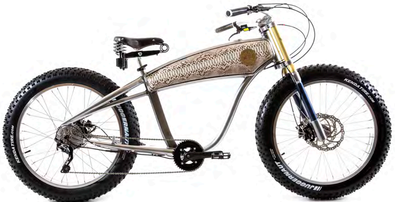
E-SCRAMBLER 300 Vélo électrique