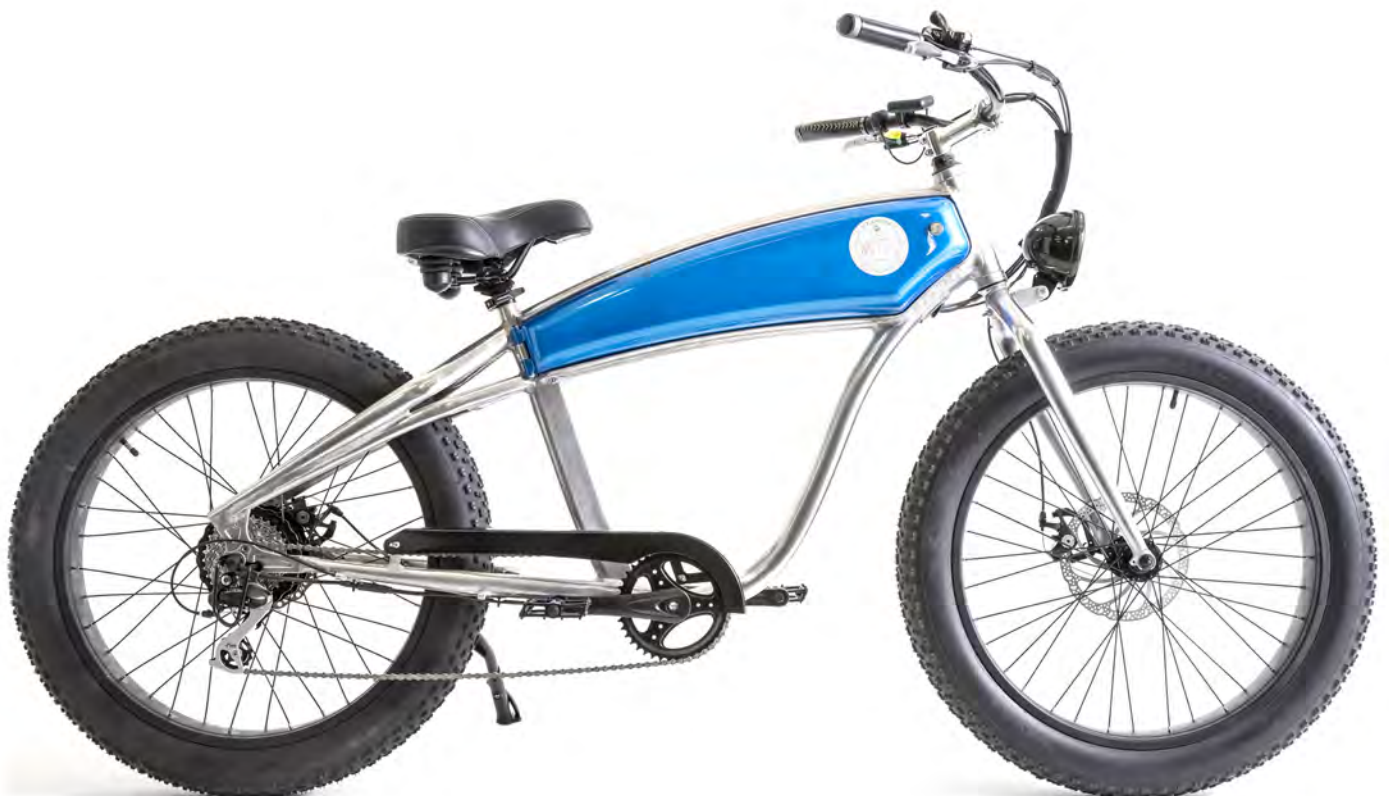
E-SCRAMBLER 100 Vélo électrique