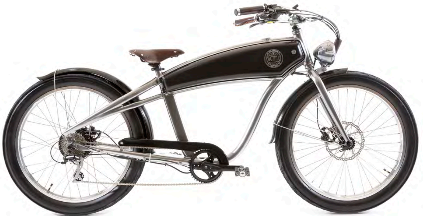
E-SCRAMBLER 50 Vélo électrique