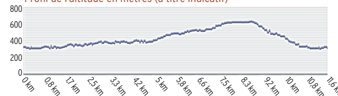
Profil de l'altitude en mètres (à titre indicatif)

5. 615 m, 31 T 507007 4821957 Après moins de 250 m, au premier carrefour, obliquer à droite sur l'autre sentier qui descend et chemine sur près de 2 km entre maquis, garrigue et châtaigneraies. Atteindre une piste, l'emprunter à gauche et rejoindre à gauche le chemin qui mène à Aigues-Vives.