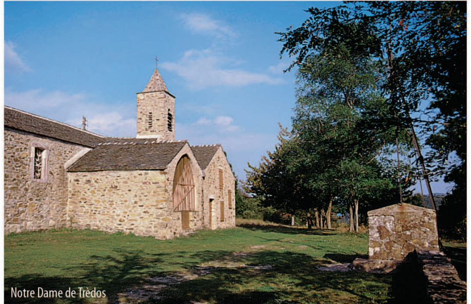
Notre Dame de Trèdos

Dominant la vallée du Jaur et offrant de magnifiques points de vue, ce circuit vous emmène à travers le massif forestier des Avant-Monts, jusqu'à la chapelle de Notre Dame de Trèdos, ancien lieu de pèlerinage, au cœur d'une petite enclave agricole au paysage ouvert.