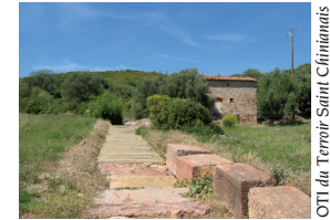
Entrée du site de Coumiac

1. Du parking de la plage du camping, la rivière dans le dos, partir à gauche et longer celle-ci. Laisser le premier chemin à droite, s'engager dans le second jusqu'à la route goudronnée. Prendre celle-ci à gauche "prudence". Suivre la route qui fait un virage à droite.