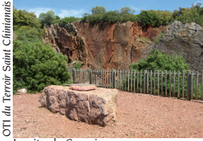
Le site de Coumiac

Sur le site de Coumiac se trouve une ancienne carrière calcaire de "marbre griotte" exploitée jusqu'en 1965. Les couches de calcaire qu'on y observe se sont formées sur une plateforme marine à environ 200m de profondeur et ont enregistré l'évolution des différents organismes marins comme les trilobites et les goniatites (céphalopodes). Depuis la multiplication des premiers organismes, plusieurs crises ont marqué l'histoire de la vie ; celles-ci se traduisent par une forte réduction de la biodiversité, à laquelle succède l'apparition d'espèces nouvelles. L'une d'elles a marqué le milieu de l'ère Primaire (il y a 365 millions d'années) entraînant la disparition de 80% des organismes marins de toutes les mers du globe. L'enregistrement de cette crise est particulièrement remarquable au sein des couches géologiques affleurant dans la carrière de Coumiac : c'est pourquoi, celle-ci a été sélectionnée en 1989 à Washington par le "Comité International de la Stratigraphie" pour devenir la référence mondiale de la limite Frasnien - Famennien (-408 à -355 millions d'années). La classification récente de ce site en "Réserve Naturelle Volontaire" permettra d'assurer sa conservation.