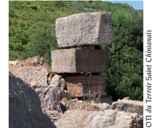
Bloc de marbre

2. 67 m, 31 T 503122 4811411 Au croisement, quitter l'avenue de la Garenne et continuer sur la route goudronnée de gauche, passer devant "La Grange Neuve".