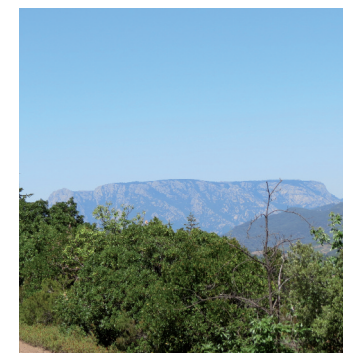
Vue sur le Caroux