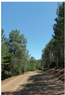
OTI du Terroir Saint Chinianais