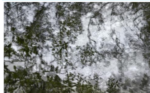
Musée de Lodève

EXPOSITION ÉRIC BOURRET - TERRES - MUSÉE DE LODÈVE LODEVE