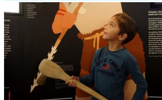
Musée de Lodève

Plein tarif : 7 € Tarif réduit : 5 € Tarif enfant : 1 €