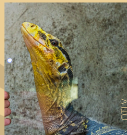
Le reptilium du Larzac