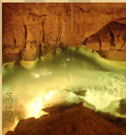
Grotte de Label