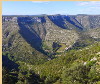
Cirque de Navacelles