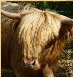
Le parc du Theil

Les sites Templiers et Hospitaliers du Larzac