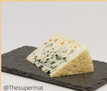
Caves de Roquefort