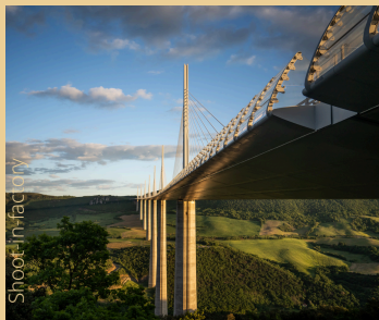
Viaduc de Millau