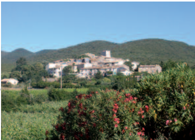
Village de Caussiniojols

Adossées à la Montagne Noire, face à la mer, les vignes du Cru Faugères s'accrochent aux villages et en terrasses au-dessus de la plaine languedocienne.