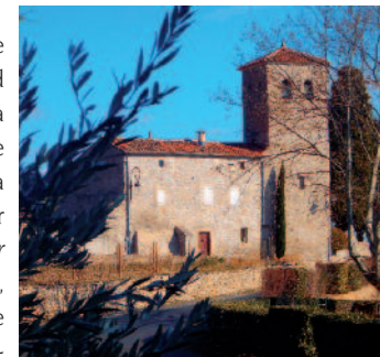
Presbytère de Caussiniojous