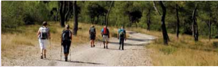
Sur le territoire des communes de : ASSAS, SAINT-VINCENT-DE BARBEYRARGUES