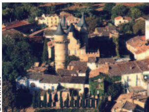
Village de Margon