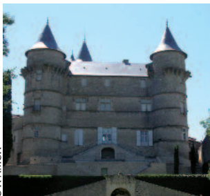
Château de Margon

Le village médiéval bâti en circulaire s'est développé autour du château féodal. Cet édifice à l'allure fière et dominante attirera sans doute votre regard vers ses tours et tourelles aux couleurs chaudes et rassurantes. Autrefois protégé par ses remparts, deux portes donnaient accès au village : la plus grande dite "de la Fontaine" n'est plus visible mais la plus petite dite "Portalet" a su résister aux ouvrages du temps. Ses habitants seront heureux de vous accueillir, dans ce lieu unique où féodalité côtoie la modernité.