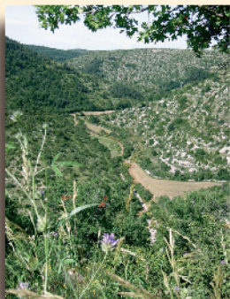
Vallon des Mourgues

En suivant le lit sec de cette curieuse rivière, où les dépôts de galets alternent avec de grands rochers plats et des blocs chaotiques, on atteint la paisible ferme des chevriers du Camp d'Alton, à la confluence avec le ruisseau de Sorbs. Par cette nouvelle voie sèche, le parcours s'engage dans des méandres bien ouverts, sur un ruban d'étroites prairies, au pied des anciennes terrasses du tènement des vignes. La remontée vers le plateau, à travers bois et garrigue, aboutit près du château des seigneurs de La Treille (XVI e s.) et d'une croix (XVIII e s.), inscrits aux Monuments historiques.